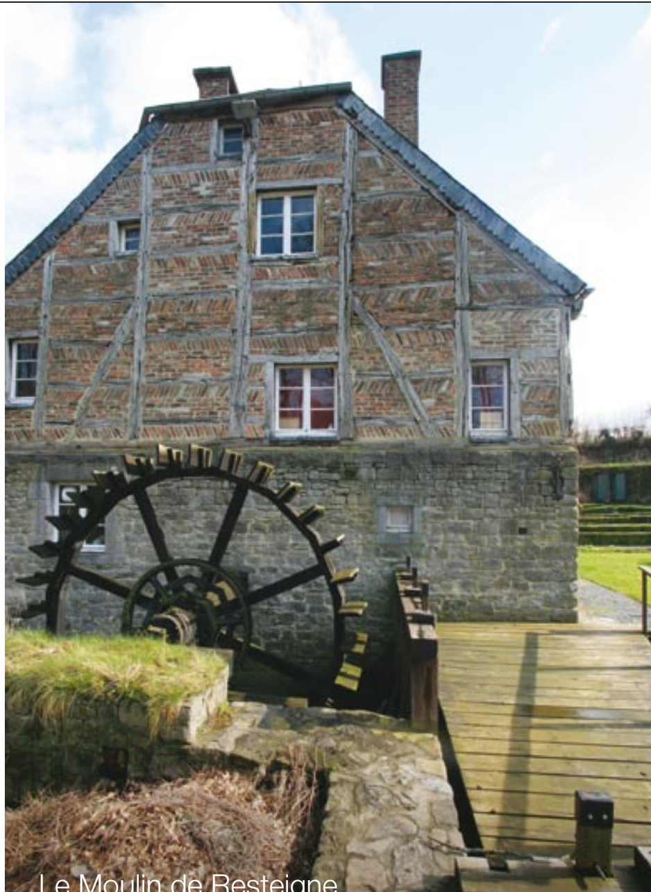
Le Moulin de Resteigne

Une chambre d'hôtes, c'est un peu comme un Bed and Breakfast. Une maison habitée qui vous accueille dans des chambres dédiées à cet usage. Comme dans un hôtel, les visiteurs ont leur chambre particulière et leurs sanitaires sont généralement privés. La rencontre avec les propriétaires est primordiale et il faut savoir que les hôtes considèrent leurs visiteurs comme des amis invités dans leur maison. Ces derniers ont leurs quartiers et sont libres de disposer du petit salon, de regarder la télévision ou de s'isoler pour lire. Les chambres d'hôtes ne se trouvent pas seulement à la campagne, il y en a également dans les villes, comme à Bruxelles ou à Bruges. Le petit-déjeuner est toujours inclus dans le prix de l'hébergement. Il est pris le matin dans la salle à manger commune. Parfois, les lieux proposent la table