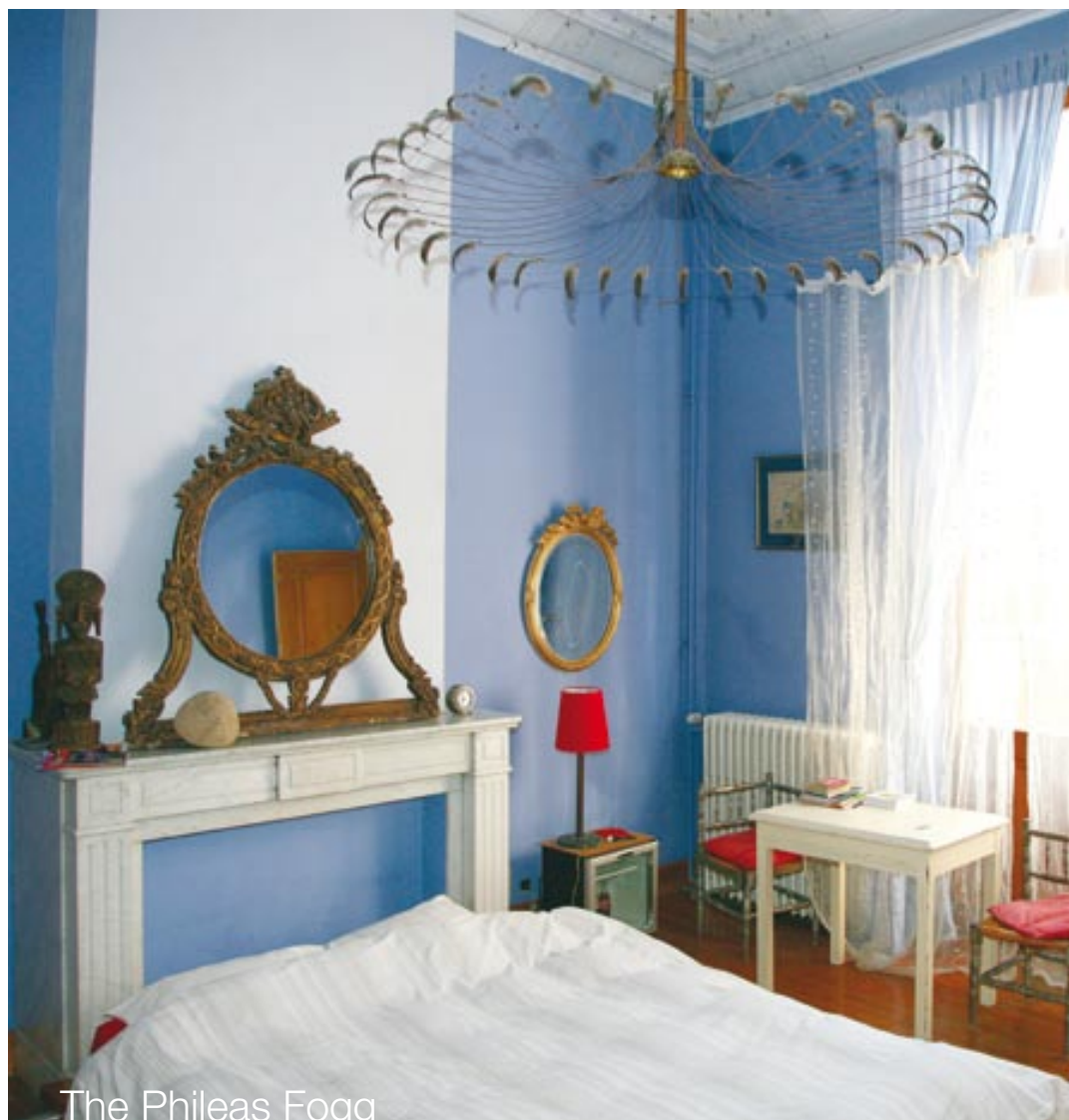
The Phileas Fogg